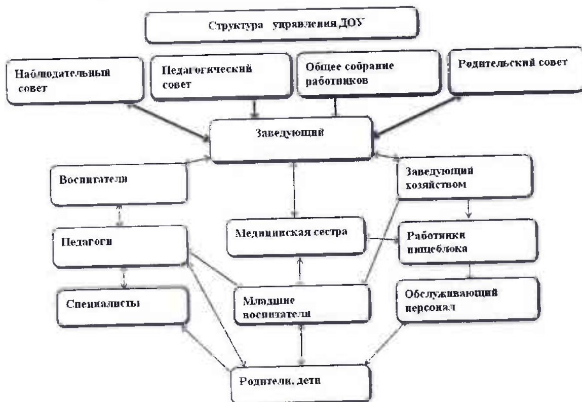
Органы управления, действующие в Детском саду

Управление Детским садом строится на принципах единоначалия и коллегиальности. Коллегиальными органами управления являются: наблюдательный совет, педагогический совет, общее собрание работников, родительский совет. Единоличным исполнительным органом является руководитель – заведующий.